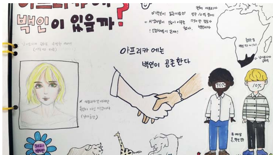
개별완성작 -고정관념(아프리카에는 흑인만 있다.)